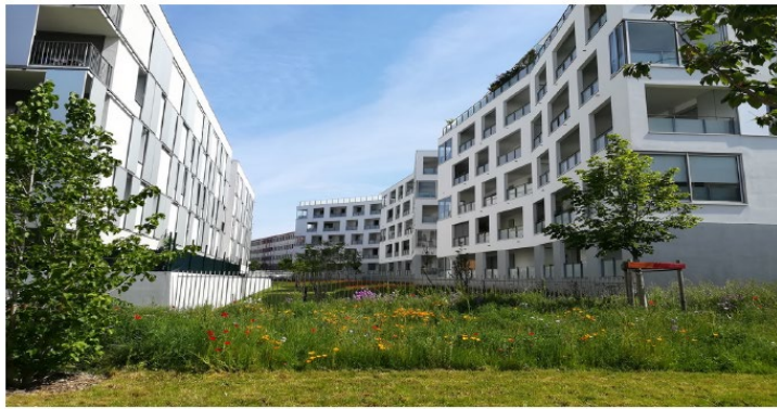
Quartier Mermoz, Lyon 8.

Politique de la ville et transitions Contribution des centres de ressources politique de la ville Novembre 2021