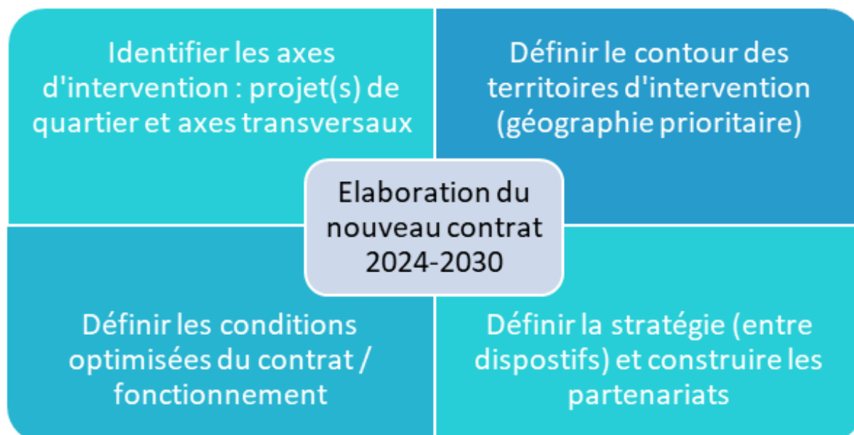
Schéma 3 – Les principales étapes pour élaborer le contrat de ville 2024-2030